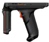
RFID - версия