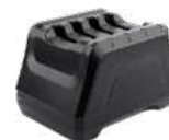
4-х зарядная станция для батарей