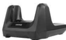
Зарядная станция (Cradle)