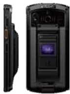
Фингерпринт - версия