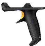
Сканер штрих-кода с триггером